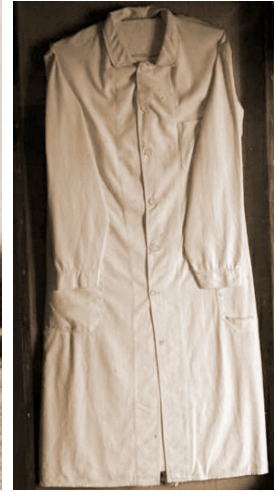
3. kép: Batthyány orvosi köpenye