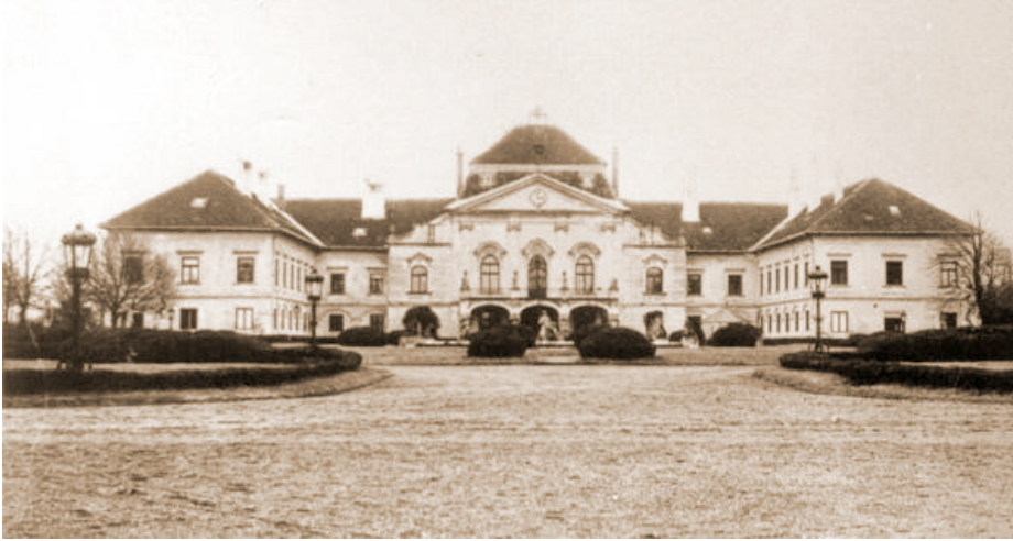
2. kép: A Batthyányak kőrömdi kastélya