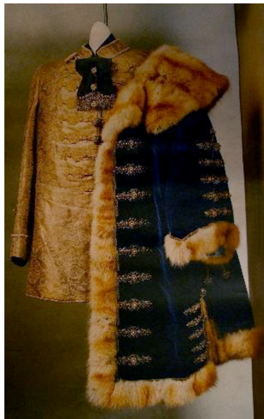
10-11. kép: Batthyány-Strattmann László díszmagyarja