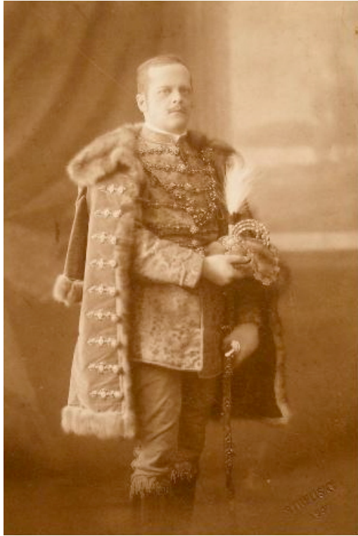
8. kép: Batthyány-Strattmann László díszmagyarban