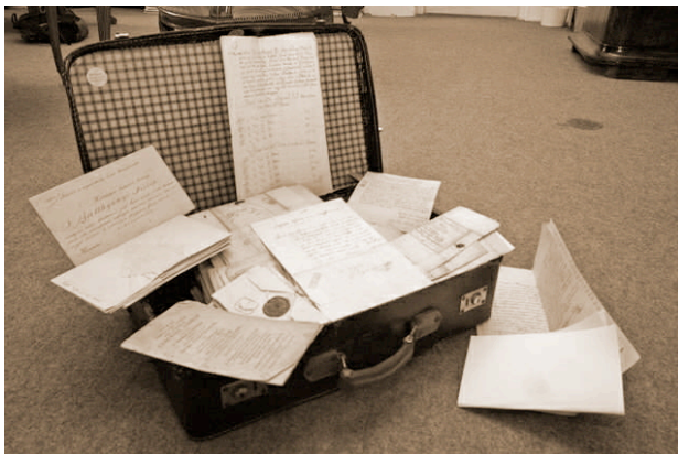
6. kép: Értékes dokumentumok a kőrömdi kastélyból

A Szegények Orvosa – dr. Batthyány-Stratmann László élete