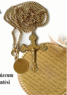
7. kép: Személyes tárgyai egy kiállítási meghívón

A kiállítás látogatható: Hétfő és vasárnap kivételével naponta 10-17 óráig. Belépődíj: 800,- Ft (kedvezményes: 400,- Ft), mely a múzeum valamennyi kiállításának megtekintési lehetőségét tartalmazza.