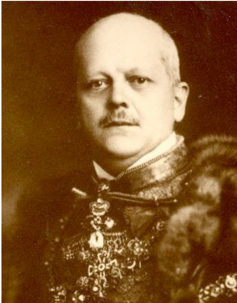
12. kép: Batthyány-Strattmann László az Aranygyapjas Rend jelvényével és a Vöröskereszt tiszti díszjelvényével