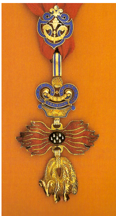
13. kép: Az Aranygyapjas Rend jelvénye