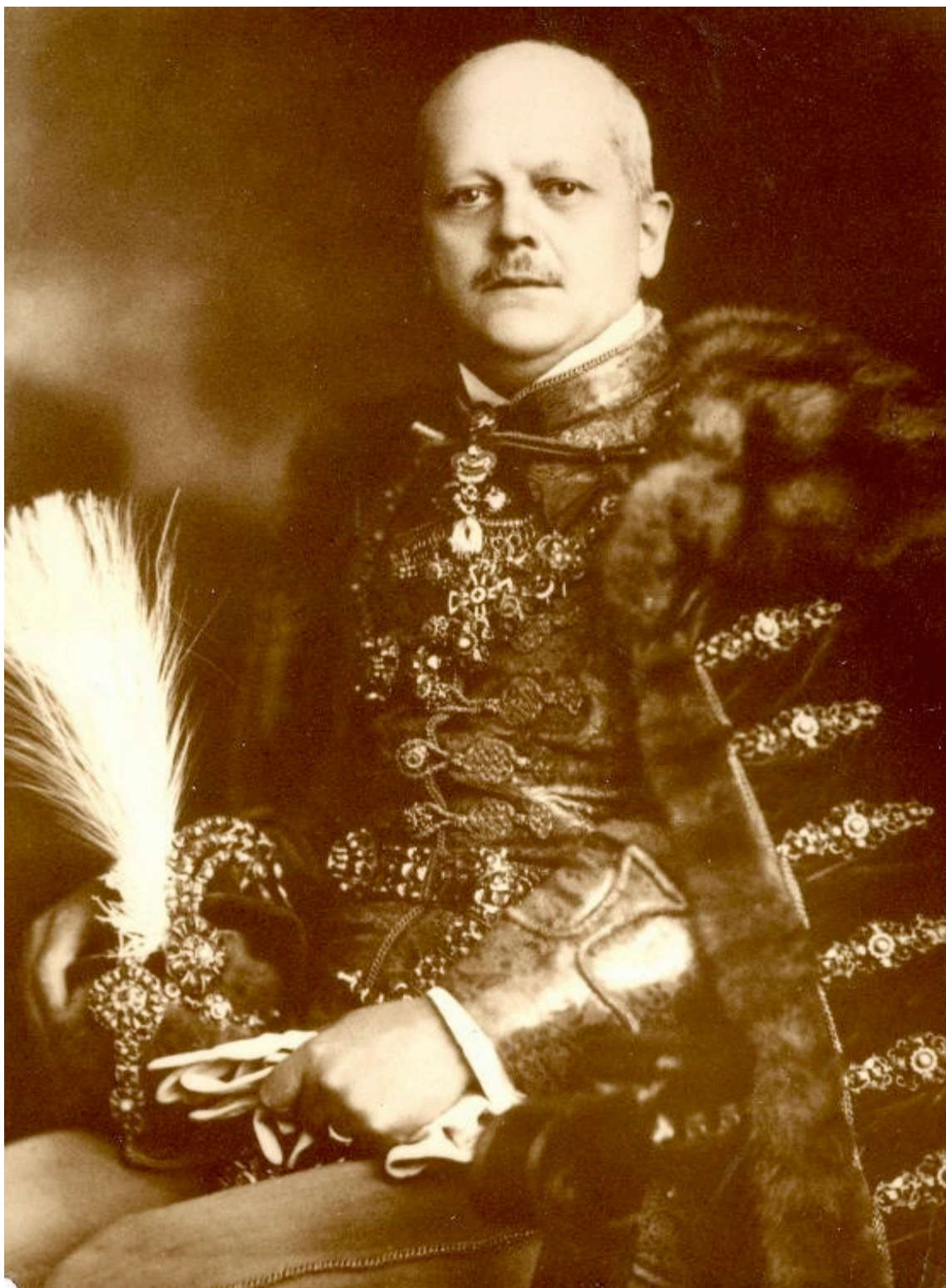
1. kép: Boldog Batthyány-Strattmann László az 1931-ben megjelent Nemzeti Magazin címlapján