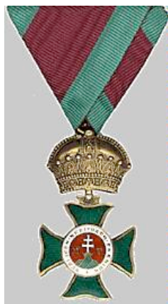
15. kép: A Szent István Rend kiskeresztje