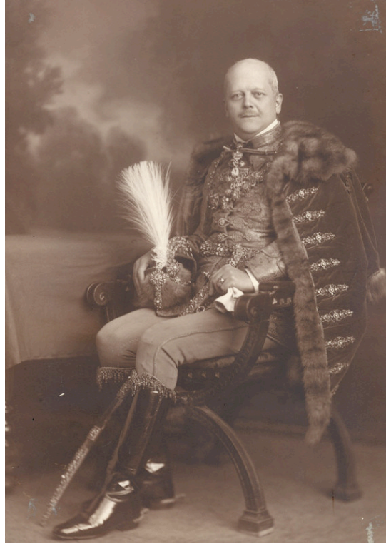
9. kép: Batthyány-Strattmann László díszmagyarban