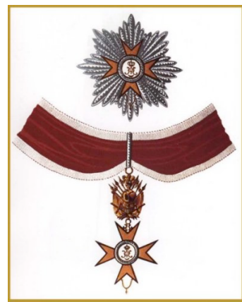
16. kép: A pápai Aranygyapjas Lovagrend jelvénye (lennt)